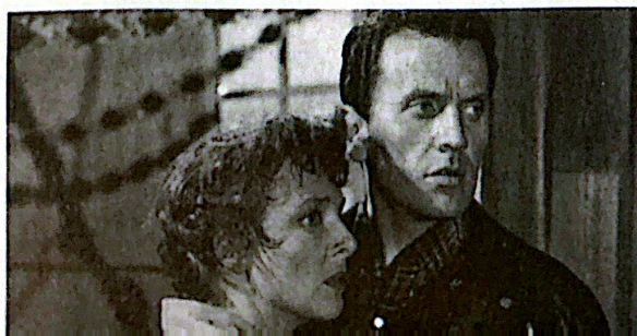
L'Amour d'une femme de Jean Grémillon (1953).

entre l'hypnose natographique. ne fois de plus ir » David nondain. e le réalisateur ey, Whirlpool de Preminger d'intrigue frôle, essive et son non seulement convaincue o et un mari ene Tierney,