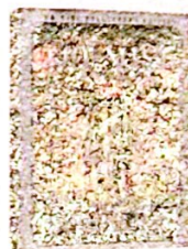
The Mist , de Frank Darabont, États-Unis, 2003. Dimension Films et TF1 Vidéo.

Il fallait au moins une tempête pour faire table rase du style rhumatismal de Frank Darabont, embourbé dans la nostalgie de l'âge d'or hollywoodien (mais toujours numéro un du classement IMDb avec Les Évadés ). Celle qui ouvre The Mist sert sa parabole sur un plateau, avec l'éventration de l'atelier du héros, affichiste old school en rogne contre Photoshop. Darabont, c'est lui, artiste forcé par les circonstances à sortir se frotter au monde d'aujourd'hui. Et ce qu'il trouve à l'extérieur reflète plus que la simple agoraphobie : un brouillard meurtrier, faisant dégénérer des courses au supermarché en opération de survie. « Il n'y a rien dans la brume » soutient un réfugié hystérique, malgré ce rideau de fer qui enfle tel un diaphragme, sous la pression d'assaillants invisibles. Dehors, « rien », le désert, bien plus labyrinthique que les pénitenciers des Évadés ou de La Ligne verte . S'y enfoncer, risquer d'errer sans fin ou s'effacer : c'est la mise en scène de la fameuse paralysie face à la page blanche (thème récurrent chez Stephen King, auteur de la nouvelle ici adaptée).