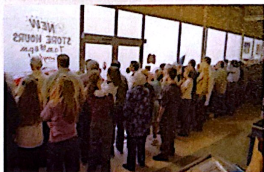
The Mist .